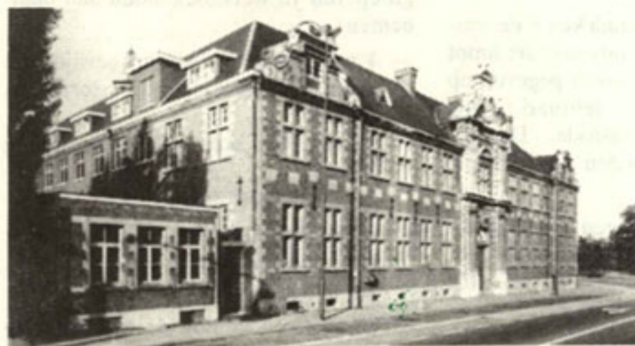
De oude gevel langs de Thonissenlaan zal volledig worden bewaard

De totale terreinoppervlakte beslaat 2.395 m 2 , waarvan 1.646 m 2 bebouwd.