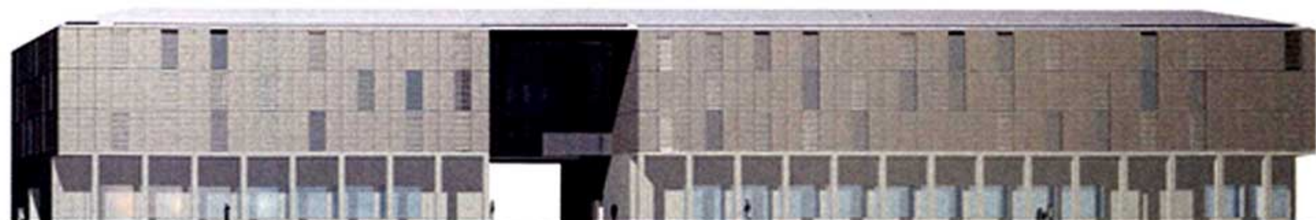
prospetto ovest, verso l'Università/west elevation, towards the university