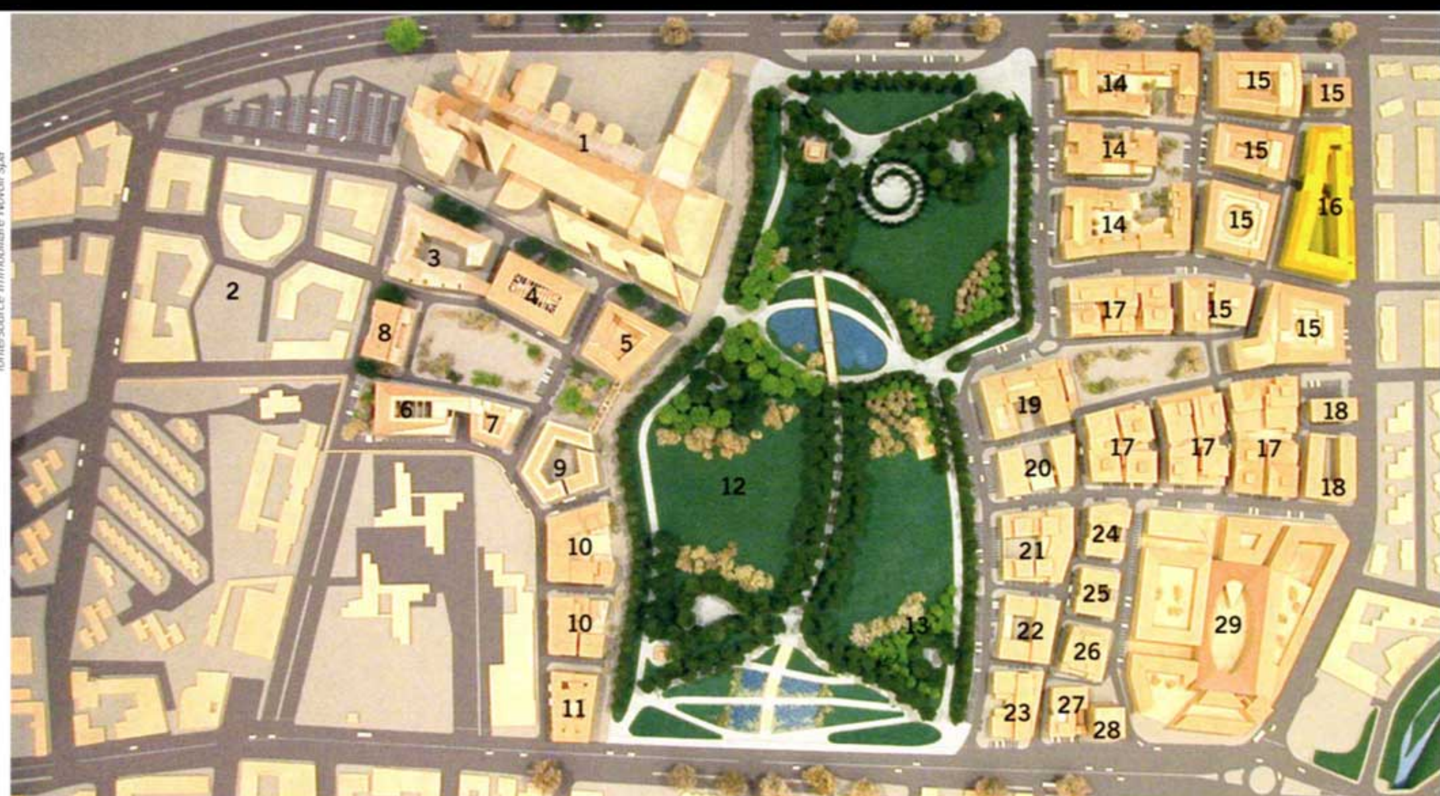
modello dell'area ex Fiat di Novoli, con l'indicazione degli interventi del piano di recupero/model of the former Fiat site at Novoli, showing rehabilitation schemes