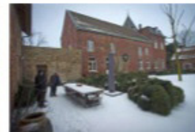
Het binnenerf met arduinen tafel.