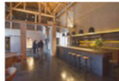
Het café in de vroegere tiendenschuur.