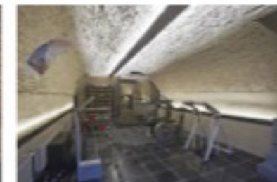
De fitnessruimte: zowel voor gasten als voor de werknemers.