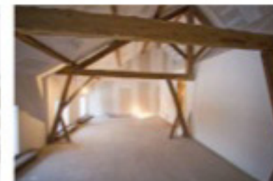
Deze zomer zijn de gastenkamers klaar.