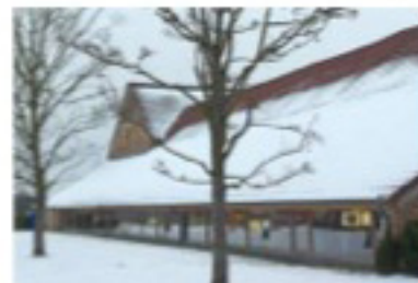
Voorheen waren dit stallen, nu is dit kantoorruimte.

"De binnenkoer had de boer dan weer helemaal dichtgepapt. Geen