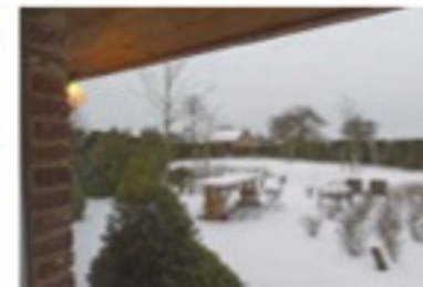
De besloten wellness tuin.