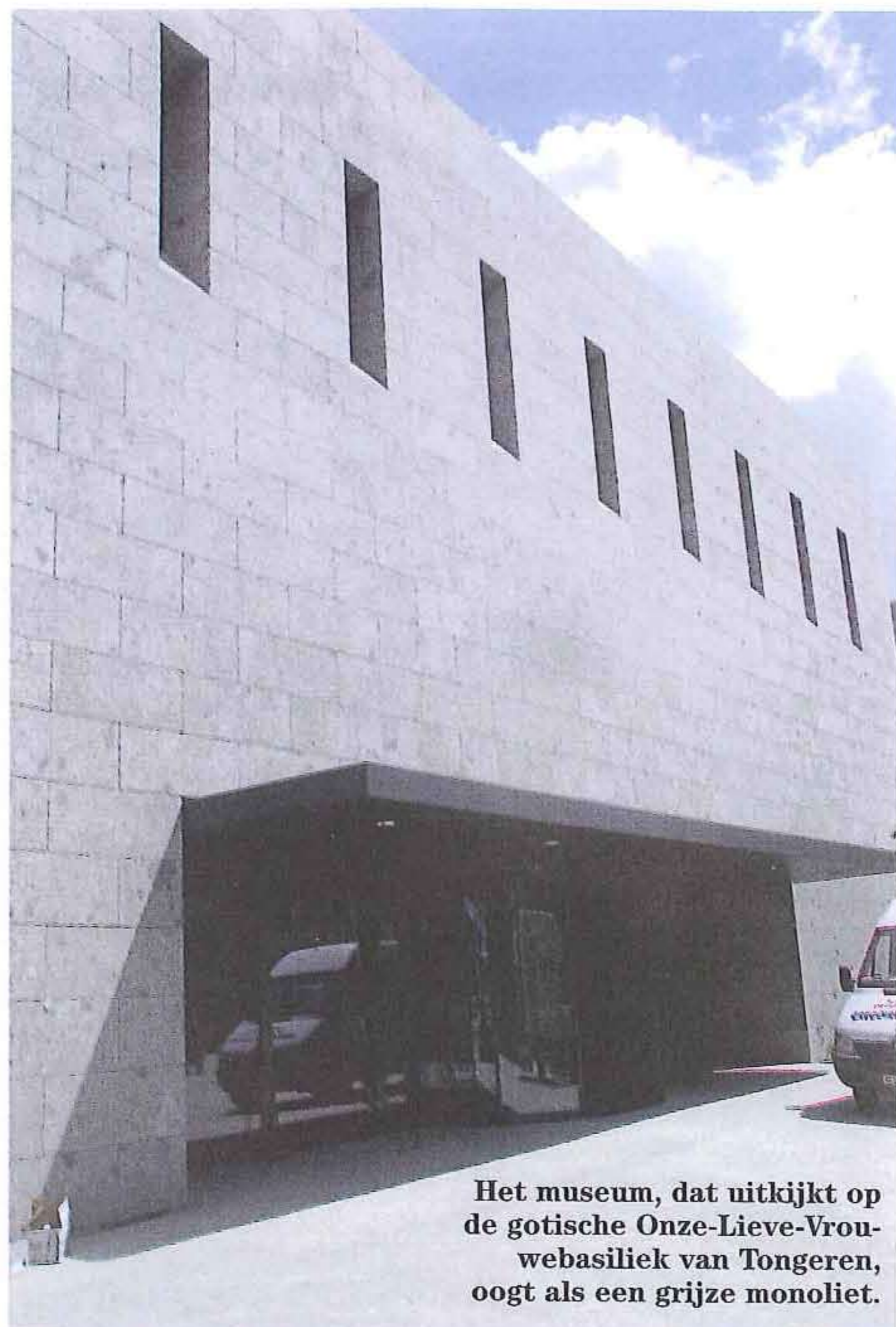
Het museum, dat uitkijkt op de gotische Onze-Lieve-Vrouwebasiliek van Tongeren, oogt als een grijze monoliet.

Aan de museale inrichting werd meegewerkt door tv Niek Kortekaas – De Gregorio & Partners (ontwerp), Helena (Emanuel Maes; grafisch ontwerp), Ans Hubert i.s.m. de vertaaldienst van de provincie Limburg (eindredactie paneelteksten), Reynders B&I (metaal- en glaswerken, schrijnwerkerij, verlichting en elektriciteit), Maverick ICS (Johan Schelfhout) i.s.m. de Audiovisuele Studio van de provincie Limburg (mediadesign, audiovisuele en interactieve producties), Video-